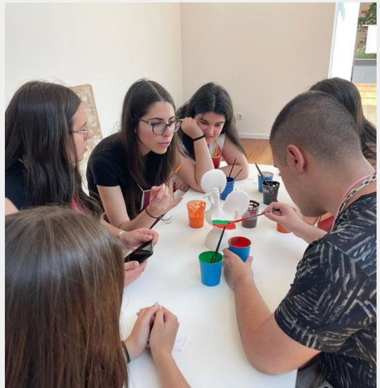
Uno dei gruppi di lavoro

Grazie a questa attività il gruppo Erasmus ha avuto un contatto con la cultura locale.