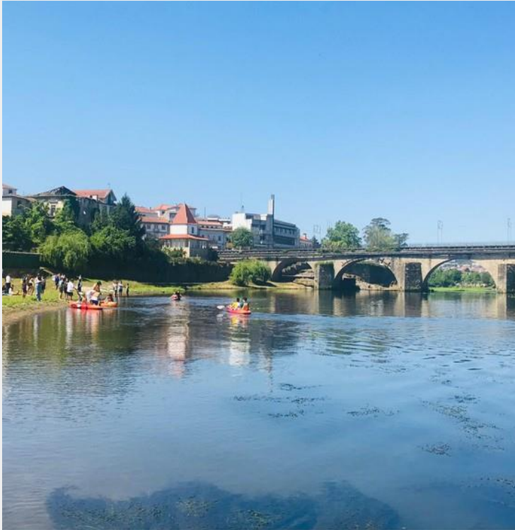
Students preparing for canoeing