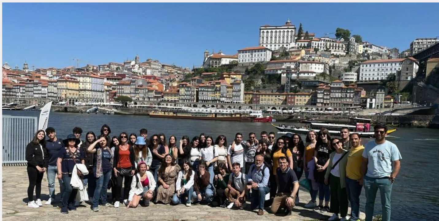
I gruppi dall'Italia, dalla Bulgaria e dal Portogallo sul fiume Douro a Porto

BARCELINHOS ACCOGLIE I PARTNER ITALIANI E BULGARI